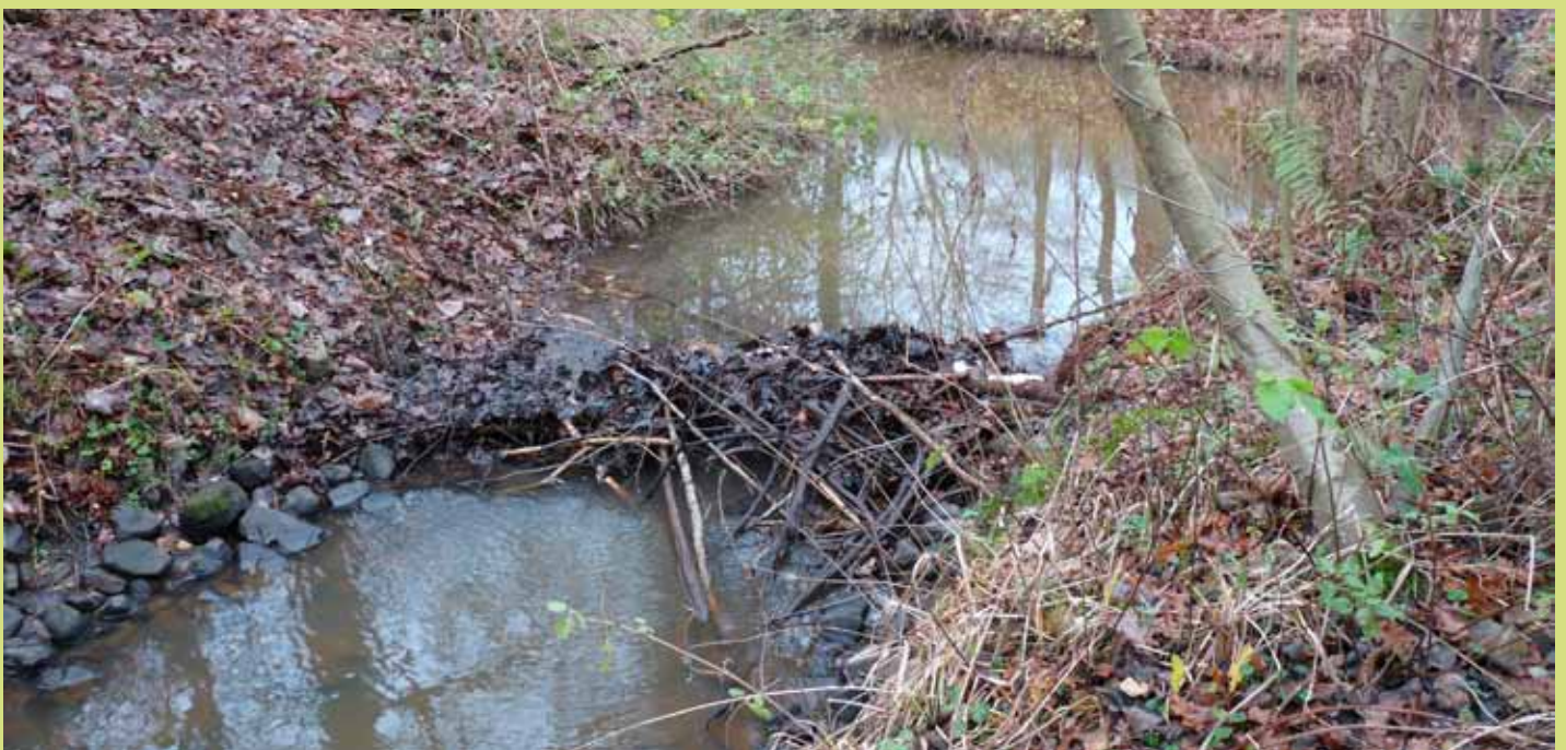
Leudal: Bevers hebben eind 2009 een poging ondernomen om een dam te bouwen in het Leudal. Helaas voor de bevers kon de dam door het geweld van de sneeuw (en daardoor veel afvoerend water) geen stand houden. Maar hierbij een leuke foto!