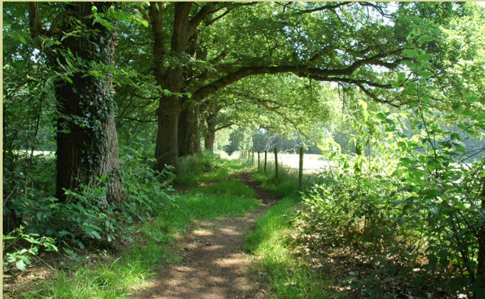
Voor wandelaars is het Stelkampsveld een prachtig gebied.

Het ontwerp-aanwijzingsbesluit voor Stelkampsveld wordt waarschijnlijk in het voorjaar van 2009 ter inzage gelegd. Nadat het beheerplan is gemaakt, worden de definitieve grenzen vastgesteld. De minister heeft gezegd dat nieuwe natuur wordt meebegrensd als dat nodig is om de natuurdoelen van een gebied te kunnen realiseren.