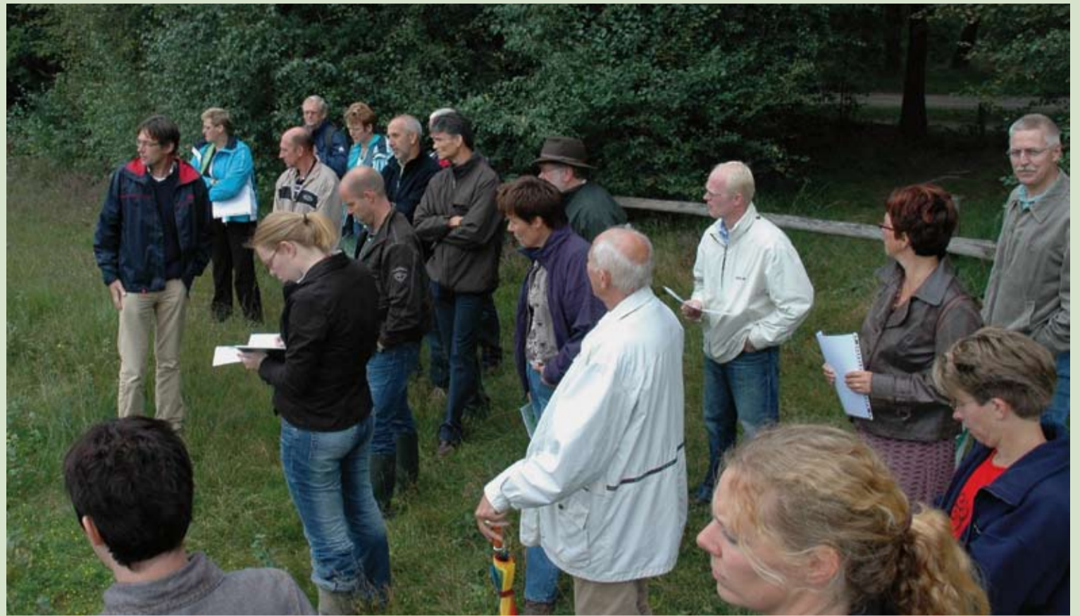
Leden van de stuurgroep bezoeken het Stelkampsveld.

Maar wat het drietal eigenlijk het meest stoorde op de bewuste informatiebijeenkomst was dat zij zich als bewoners niet serieus