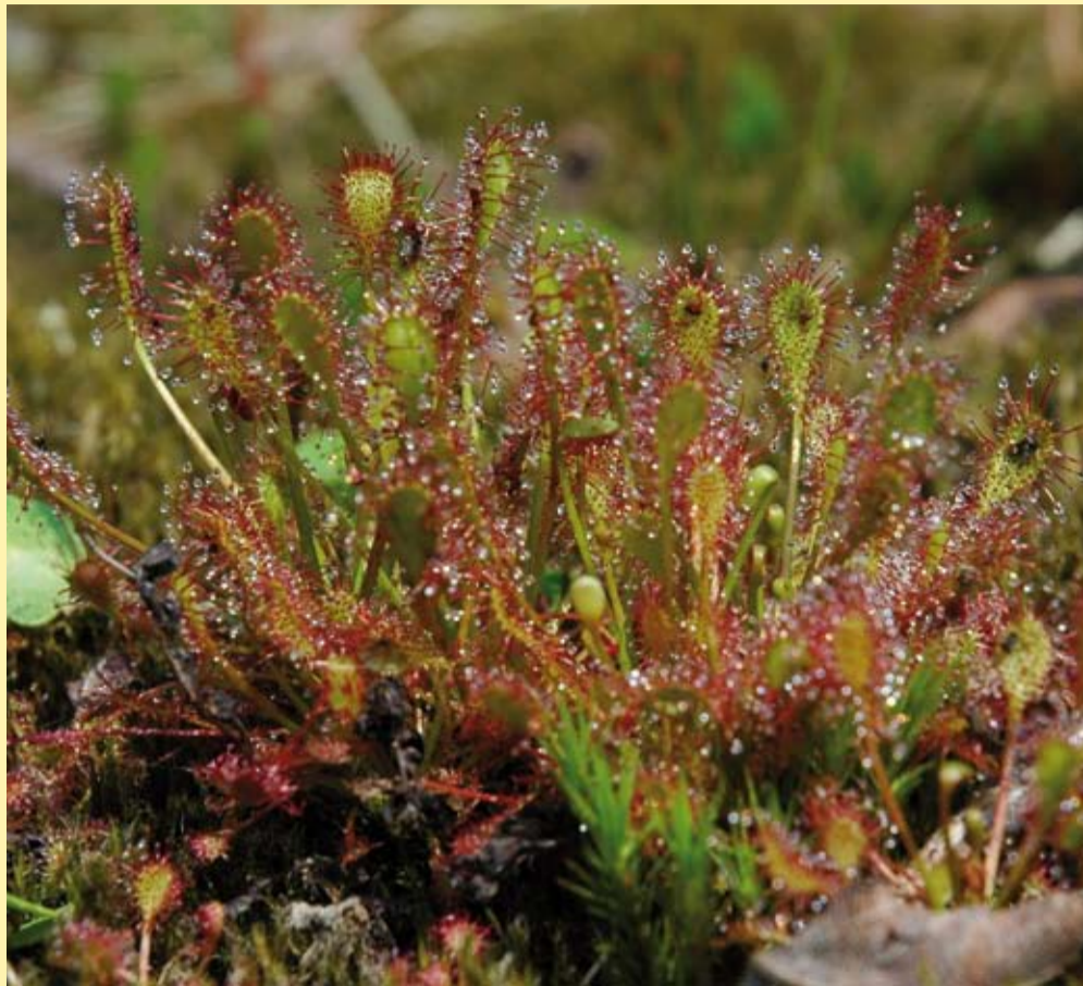
De zonnedauw is een vleesetend plantje. Deze plant groeit alleen op afgeplagde, natte heidevelden.

De provincie wil graag alle belanghebbenden bij de totstandkoming van het beheerplan betrekken. De stuurgroep wordt om een inhoudelijke reactie gevraagd op het conceptbeheerplan. Deze reacties worden